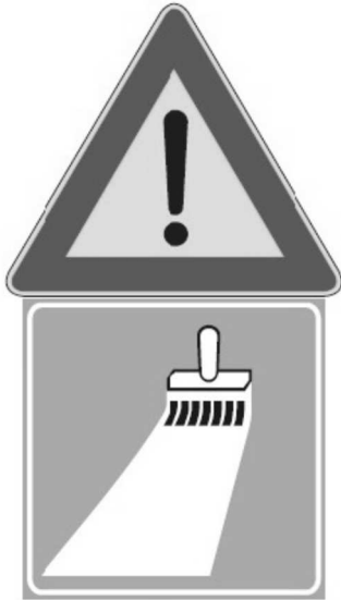
Figura II 391 Art. 31