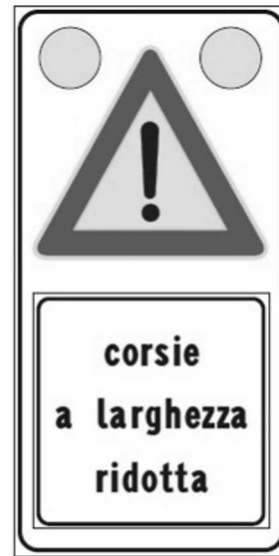
Figura II 391c Art. 31